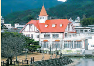
대중탕 시블트유 중점 부근에 위치한 우레시노의 상징