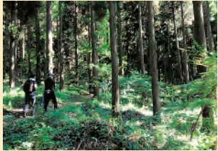
22세기 아시아의 숲 초여를 신록, 가을단풍이 아름다운 메타세쿼이아

풍요로운 자연과 삶의 터전의 자취를 볼 수 있는 길 전국유수 녹차의 명산지·우레시노 기원을 찾아 보며 일본3대 미용 온천욕을 즐길 수 있다.