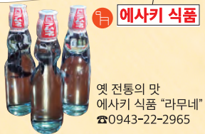
에사키 식품 옛 전통의 맛 에사키 식품 "라무네" ☎0943-22-2965