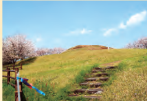
마루야마즈카 고분 정면에서 야메의 상징 토비카타야마(산)과, 야메시 전경을 한눈에 볼 수 있는 대형 원분.

스탬프 찍는 곳 편의점MINI STOP 야메산점 에사키 식품 야메시 이와토야마 역사문화교류관 (9:00~17:15 입관 17:00까지) 휴관: 월요일(공휴일엔 이튿날), 연말연시 야메시 이와토야마 역사 문화교류관 (9:00~17:15 입관 17:00까지) 휴관일: 월요일(경축일·휴일이면 이튿날), 연말연시