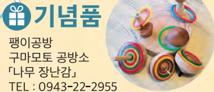
기념품 팬이공방 구마모토 공방소 "나무 장난감" TEL : 0943-22-2955