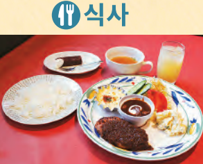
비후테이 런치 ☎0943-22-2982