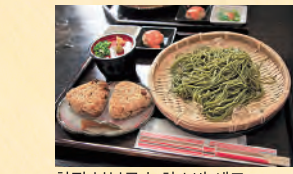
차집 분부쿠 녹차소바 세트 ☎0943-24-2000