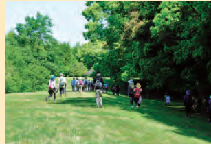
이와토야마 고분 북부큐슈에서는 최대규모의 전방후원분형 고분