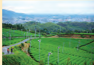
야메 중앙 대다원 야메를 대표하는 다원 전망소에서 경치가 단연 빼어나.

스탬프 찍는 곳 편의점MINI STOP 야메산점 에사키 식품 야메시 이와토야마 역사문화교류관 (9:00~17:15 입관 17:00까지) 휴관: 월요일(공휴일엔 이튿날), 연말연시 야메시 이와토야마 역사 문화교류관 (9:00~17:15 입관 17:00까지) 휴관일: 월요일(경축일·휴일이면 이튿날), 연말연시