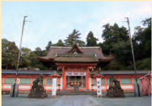
고라 타이사 지쿠고국 이치노미야. 국경중요문화재.