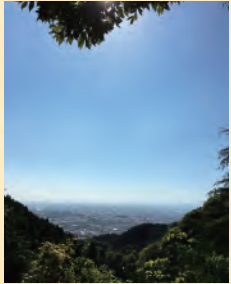
코이미노루 (사랑이 이루어지는) 전망대 운젠 후겐다케를 바라볼 수 있다.