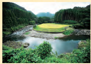
고메노쓰가와(강)유역 무논지대 고메노쓰 강을 낀 아름다운 산과 들 풍경

스탬프 찍는 곳 이쓰쿠시마 신사 (8:00~17:00) 이즈미 후모토 역사관 (9:00~17:00 정기휴무일: 제3수요일) 공개 무가저택「다케조에 저택」 (9:00~17:00 연중무휴)