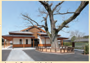
이즈미 후모토 역사관 무가저택군이 있는 이즈미 후모토 지역의 역사자료를 전시