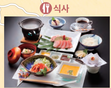
이즈미에서만 맛볼 수 있는「이즈미 아오코 스테이크 달걀」 (가게 정보는 관광교류과에 문의바람)