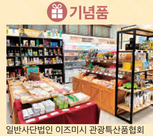
기념품 일반사단법인 이즈미시 관광특산품협회

이즈미코스 문의 이즈미시청 상공진흥과 ☎0996-63-2111 일반사단법인 이즈미시 관광특산품협회 ☎0996-79-3030