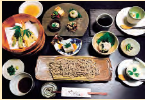
수타 소바 (오소바 나나쿠사) ☎0944-62-7622