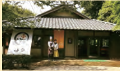
카페 레스토랑 「하루」 ☎0944-63-5511